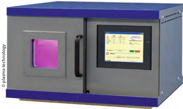
Kompaktanlage mit 32 Liter Kammervolumen, platzsparender Schiebetür, Mikrocontroller gesteuert mit Industrie PC zur Visualisierung, Prozessüberwachung und -dokumentation, Massflowcontroller sowie maximal zwei Gaskanälen und 600 W Generatorleistung

gen Produkte werden mit dem Arbeitsgasstrom aus der Vakuumkammer abgeführt. Dadurch wird eine Wiederanlagerung auf der Oberfläche ausgeschlossen, so dass am Ende des Prozesses ein sehr sauberes, für den nächsten Fertigungsschritt – Bedrucken, Lackieren oder Verkleben – vorbereitetes Bauteil steht.