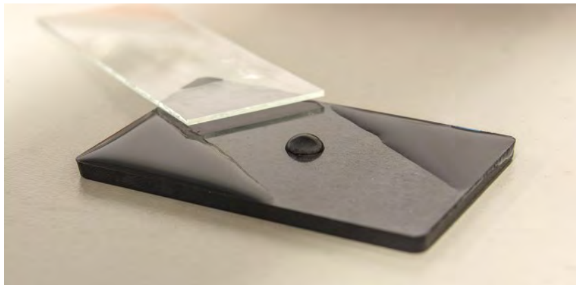
ABBILDUNG 1: Benetzung von gefülltem Polypropylen nach der Plasmaaktivierung. Der mittlere Teil war während der Aktivierung abgedeckt und wird daher nicht von Wasser benetzt.

erweitert die Möglichkeiten der Anpassung der Oberflächeneigenschaften an den Lack oder Kleber, denn die Reaktionsfreudigkeit des Materials des Werkstückes spielt nur noch eine untergeordnete Rolle, wenn zuvor eine Feinstreinigung erfolgt, was bei Plasmaprozessen ein inhärenter Prozessschritt ist (Abb. 1). Da nach der Feinstreinigung eine nackte Oberfläche ohne natürliche Adhäsionsschicht vorliegt, führt ihre Belegung mit hochreaktiven, im Plasma generierten Spezies zu einer gleichmäßigen und extrem gut haftenden Primerschicht, da unter diesen Umständen auch chemische Bindungen selbst im Falle von metallischen Oberflächen möglich sind. Die Schichten liegen Bereichen von einigen 100 nm und bilden die Oberfläche originalgetreu ab. Dies bedeutet, dass der Konstrukteur der