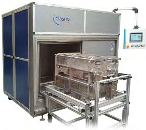
ABBILDUNG 2: Industrielle Plasmabeschichtungsanlage PlasmaActivate 1000. Die Warenkörbe werden in die Aufnahme des ausziehbaren Drehmechanismus geschoben.